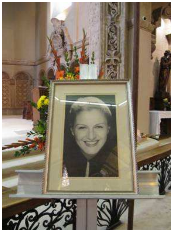
Szörényi Éva színművésznő fényképe a Borromeo Szent Károly katolikus templomban

Életének 93. évében, hosszas és fájdalmas betegséget követően 2009. december 1-jén délelőtt 11 órakor otthonában elhunyt Szörényi Éva Kossuth-díjas színművésznő. Szörényi Éva egyedülálló, szakmai színvonalában és hosszában egyaránt kiemelkedő pályát futott be. A Színművészeti Akadémia elvégzését követően a Nemzeti Színház tagja volt 1956-ig, amikor a forradalom leverése után el kellett menekülnie hazájából. Ezt követően életét a szülőföldjüktől távol szakadt magyarok összefogásának szentelte. Életének üzenete, hogy magyarságát minden körülmények között, minden nehézség ellenére megőrizte.